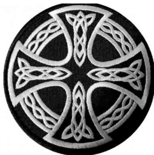
Рисунок 2. Кельтский крест. Символ многих расистских организаций