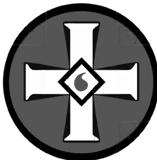
Рисунок 1. Эмблема ультраправой организации «Ку-клукс-клан»