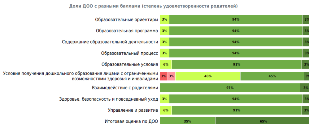
Таблица 6. Сводная таблица результатов оценки качества дошкольного образования родителями (законными представителями) по областям качества дошкольного образования

Результаты оценки качества образования в ДОО субъекта РФ с точки зрения родителей/законных представителей (степень удовлетворенности) по областям качества (по 5-балльной шкале):