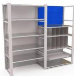
Система хранения тренажеров